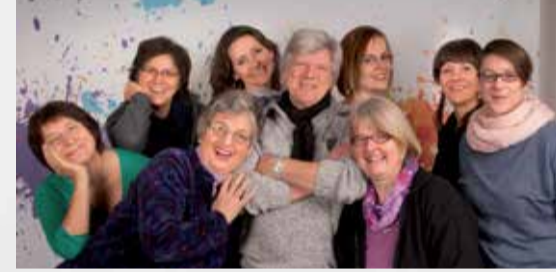
Team Diakonisches Jahr

diakonisches-jahr@afj-ekvw.de | Tel. 02304.755-179 | Fax. 02304.755-248